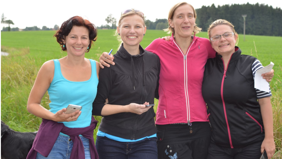
Sborová dovolená 2016: středisko Immanuel v Železných horách